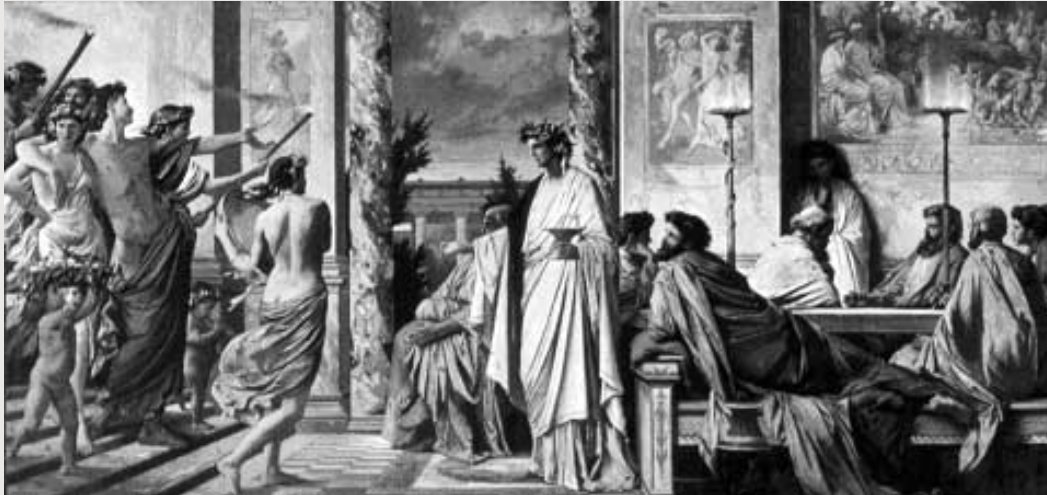
Anselm Feuerbach: Das Gastmahl des Plato, 1869. Karlsruhe, Staatliche Kunsthalle

In der christlichen Kultur des Mittelalters und der Frühen Neuzeit hat die antike Philosophie zunächst eine dienende, propädeutische Funktion für das Studium der göttlichen Offenbarung. Dies zeigt sich in einer Miniatur aus dem Hortus deliciarum (12. Jh.), aber auch noch im Bildprogramm Raffaels für die Stanza della Segnatura. In der Schule von Athen tritt jedoch ein neuzeitliches Philosophieverständnis in den Vordergrund. Platon und Aristoteles gelten als Erfüller des philosophischen Strebens und nehmen im Bild den zentralen Platz ein; der sokratische Tugenddialog, der nur über ethische Gegenstände, aber nicht über die Ursache des Ganzen handelt, ist als Vorläufer an den Rand gerückt. Die barocke Kunst zeigt Sokrates dementsprechend im Rückgriff auf antike Quellen als Vorbild in der Tugend: seine Besonnenheit und seine Aufforderung zur Selbsterkenntnis werden Bildthema. Später entstehen Zweifel am überlieferten Tugendverständnis. Auf einem Rokoko Gemälde wird Sokrates zu einem Störenfried, der Alkibiades bei einem Schäferstündchen überrascht und von Amor selbst zurückgedrängt wird.